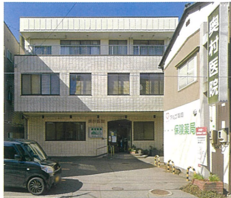
〒919-0632 福井県あわら市春宮2丁目8-3

患者様とのコミュニケーションを重視し子供から高齢者まで一人ひとりに適した医療を行い、地域に根差した医療サービスを提供し患者様の健康維持と向上に努めています。